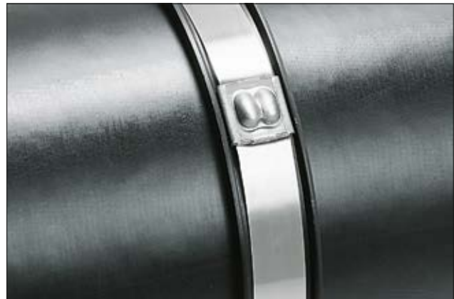
Edelstahlkabelbinder der MBT-Serie mit Schutzprofil LFPC150.